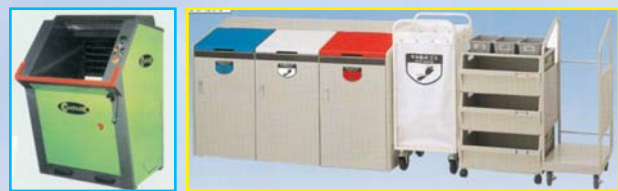
▲ロール状圧縮機 オートプレスコンパック