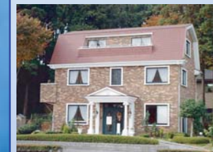
*宮環沿い鶴田町展示場*

私共ケーエムハウスは、特定の国の様式には限定せず、お客様それぞれのご希望と、ご家族のライフスタイルに合わせた『こだわりの輸入住宅』を創造し、お客様のイメージを具体化するための設計打合せを入念に行い、さらに経年に耐えうる風格と気品を加味したデザイン『=エイジングデザイン』を中心に捉えながら、住まいづくりのご提案をしています。