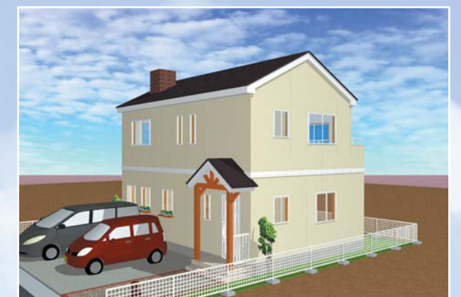
パパさんプラス イメージバス

『パパさんプラス』は『パパさん』同様「(財) 住宅性能保証機構」による10年保証住宅で すので、安心の住まいをお約束いたします。