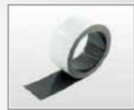
幅×長さ：50mm×25m 材質：ラバー磁石